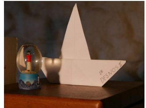
(Dans un petit bateau, Robert Desnos)

Mais s'ils trouvent un endroit, Un endroit qui va, Alors ils s'installent Et deviennent de vraie pipelettes.