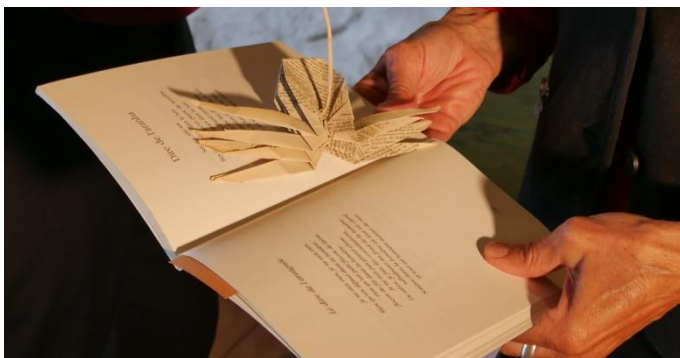
(Le dire de l'araignée, Max Rouquette)

Quand c'est fini Ils décampent, Se retournent une dernière fois, Saluent poliment, Et disparaissent Définitivement.