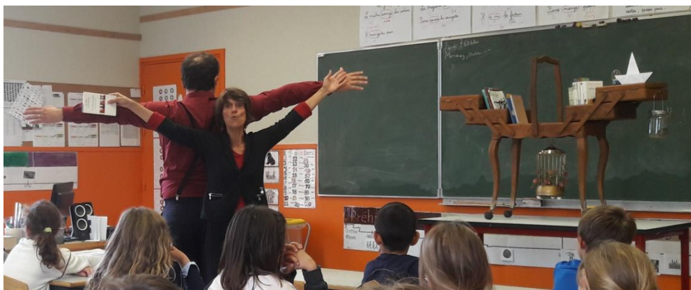
(Iles, Blaise Cendrars)