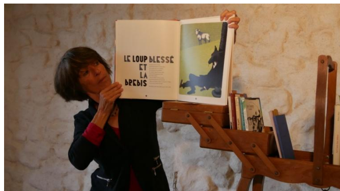
(Le loup blessé et la brebis, Esope)

Inspirés par les « brigades d'intervention poétique », ce duo déboule dans la classe sans que les enfants soient prévenus. En revanche, en amont de la représentation il sera transmis à l'enseignant.e un dossier pédagogique contenant l'ensemble des textes du spectacle. À l'issue de la représentation, les comédiens reviendront dans la classe pour échanger avec les enfants et l'enseignant.e.